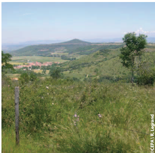
Vue de la Chaux de Vichel et Ségonzat, Saint-Gervazy