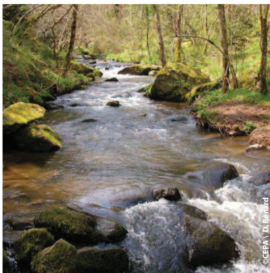
Gorges de la Monne