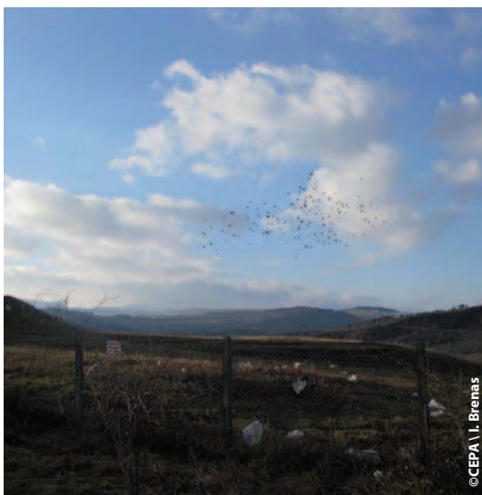
Oiseaux se nourrissant sur une décharge