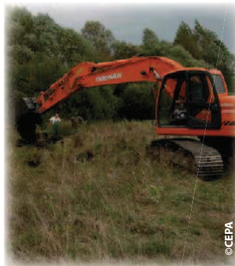
Création d'une zone d'eau libre