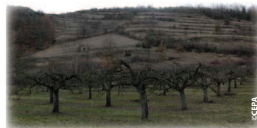
Paysage favorable aux oiseaux