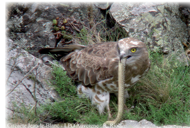
Circaète Jean-le-Blanc - LPO Auvergne : R. Riols

Deux espèces très rares de rapaces ont été recherchées dans le site Natura 2000 du Pays des Couzes. Le sud de ce site a été ciblé pour ces prospections, étant le secteur le moins connu. Les espèces concernées étaient le Circaète Jean-le-Blanc et l'Aigle botté. Cette dernière espèce n'a pas été trouvée nicheuse. A contrario, 10 zones d'installation de couples de Circaète Jean-le-Blanc ont été trouvées. Le printemps pluvieux de 2012 n'a pas favorisé la reproduction de ce rapace qui élève un unique poussin par an.