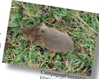
Campagnol terrestre - FDC 63 : B. Grosbety