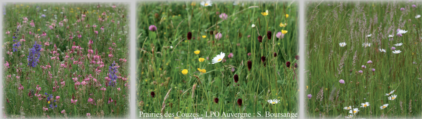
Prairies des Couzes

Les prairies riches en fleurs et en insectes sont indispensables pour les oiseaux.