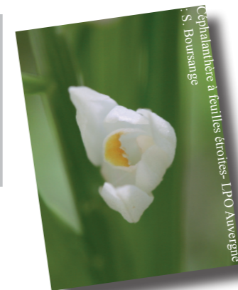
Ophélie à feuilles étroites

En 2012, la démarche Natura 2000 a été très productive sur la commune de Tourzel-Ronzières, et cela grâce en parti au bulletin municipal!