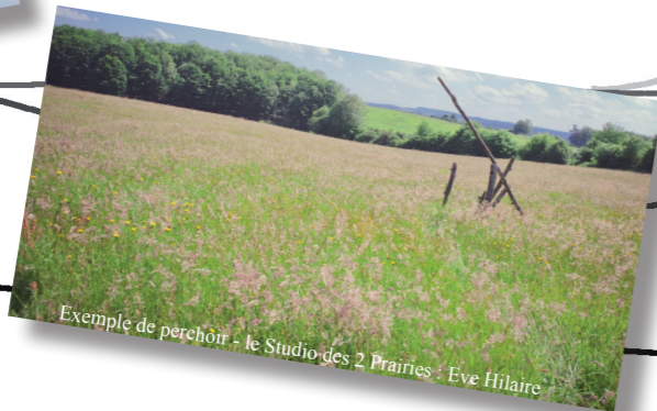
Exemple de perchoir : le Studio des 2 Prairies : Eve Hilaire

Ils augmentent l'action de chasse des rapaces. 200 perchoirs pourront être installés sur les parcelles dépourvues d'arbres.