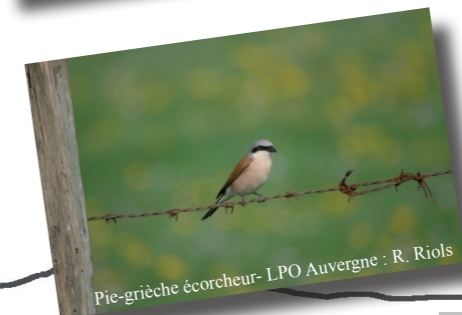
Pic-grièche écorcheur