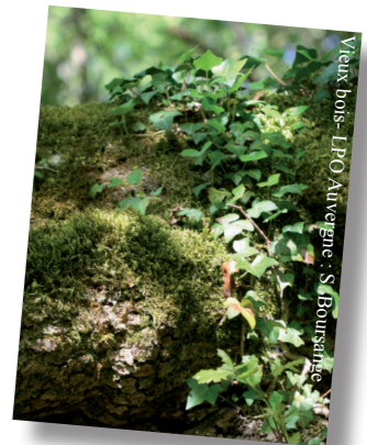
Vieux bois

Afin de préserver la nidification de deux espèces d'oiseaux d'intérêt européen, un organisateur de manifestation motorisée a accepté de déplacer la date de la course en dehors des périodes de reproduction.