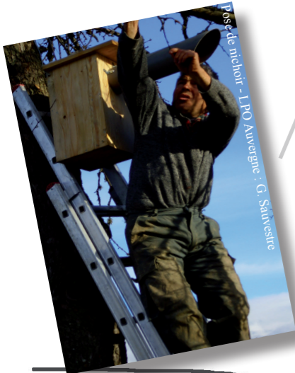
Pose de nichoir

Quelques nichoirs à rapaces nocturnes (prédateurs de campagnols) seront installés avec les volontaires.