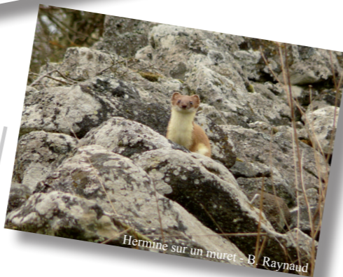
Hermine sur un muret - B. Raynaud