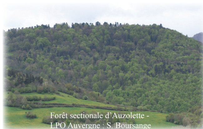
Forêt sectionale d'Auzolette

Ci-contre, voici l'exemple de la forêt sectionale d'Auzolette engagée avec l'accord de l'ONF en tant que gestionnaire.