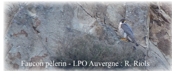
Faucon pèlerin

Par la suite les coordonnées des propriétaires de ces parcelles ont été recueillies, afin de pouvoir les contacter. L'envoi des courriers d'information aura lieu en 2013.