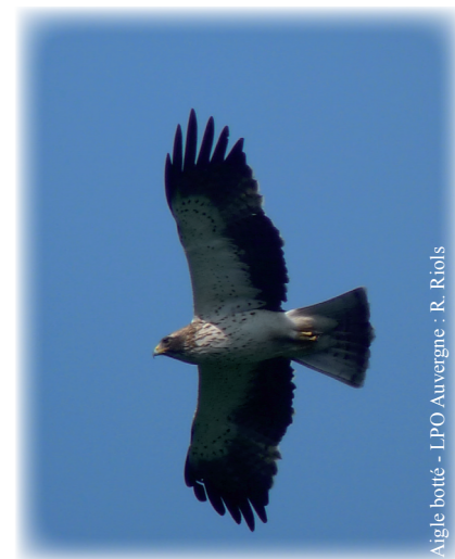
Aigle botté

Après les mesures agri environnementales territorialisées (MAET) et un certain nombre de parcelles engagées dans la Charte Natura en 2011, cette deuxième année d'animation a permis l'émergence de plusieurs contrats Natura 2000. Le plus important travail a été réalisé pour la préparation d'un contrat qui a pour objectif de limiter la mortalité indirecte des rapaces nécrophages, comme le Milan royal, par l'empoisonnement destiné aux campagnols terrestres. Les différents leviers d'action sont repris en page 2 de ce bulletin. Les autres contrats élaborés en 2012 permettront la restauration de milieu en déprise agricole. L'un d'eux est porté par une société de chasse, quelques informations supplémentaires en page 3.