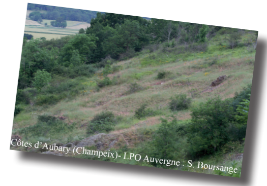
Côtes d'Aubary (Champeix)