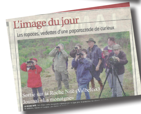
Sortie sur la Roche Nité (Valbeix) Journal «La montagne»