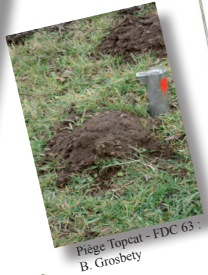
Piège Topcat - FDC 63 : B. Grosbety